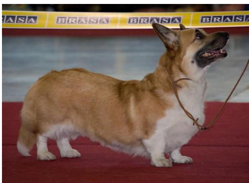
WCP – ISABELLA HIGU V2, R.CAC