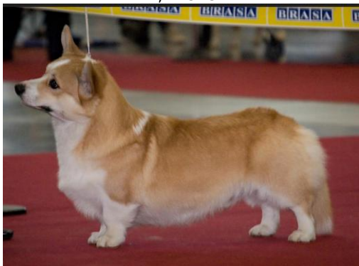
WCP – ARTUSH ROYAL CORGIS V2, R.CAC