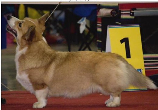
WCP - CUUCHIN DREAMS O'GOLD V1, CAC, NV