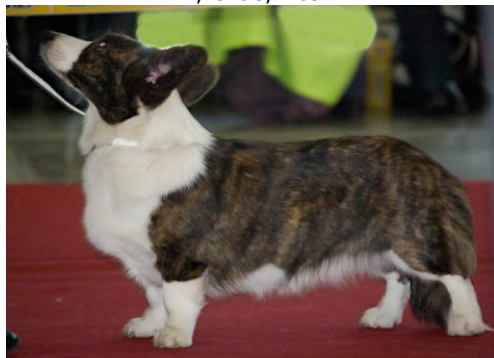
WCC – AIMY KASMIR MORAVIA V1, CAJC, BOJ