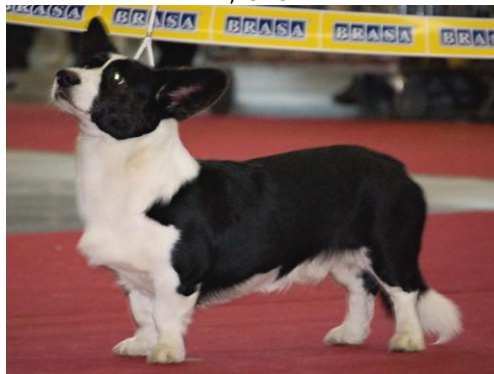
WCC – ADONIS Z IREXU V1, CAC