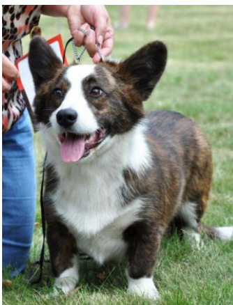
WCC - BORS SHINING SIRIUS VN1

WCP - JASCHA HIGU V1, CAC, Klubový vítěz