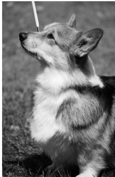
WCP - CH. AIMY KINBERGER'S