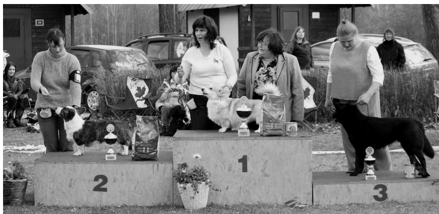
BIG FCI I