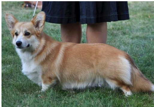
WCP - CH. DELI ZE SÍBRTŮ V1, Nejlepší veterán, BIS Veterán

WCP - JASCHA HIGU V1, CAC, Klubový vítěz