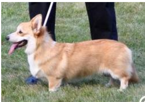
WCP - C.I.B. FELIX HIGU V2