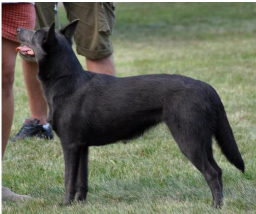
WCP - CZECH XERA 17TH MERIDIAN VN1, BIS Baby

AKE - DEFTY BLUE MOUNT MCKINKEY V1, CAJC, BOJ, BIS Junior